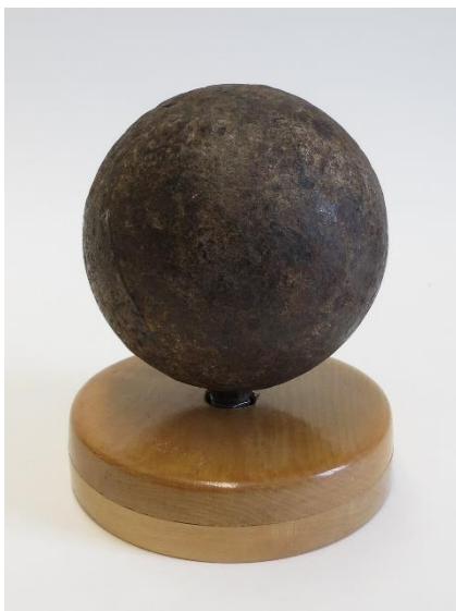
1775. Boulet trouvé aux abords de notre maison envoyé par la garde royaliste sur les Américains qui étaient devant l'habitation de nos domestiques.

Boulet de canon, 3 e quart du 18 e siècle.