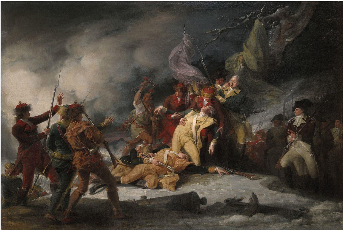
Mort du général Richard Montgomery – John Trumbull – Yale University Art Gallery

le fleuve dégagé de glaces et l'impossibilité de s'emparer de Québec, le général Thomas convoqua un conseil de guerre le 5 mai qui jugea qu'il était expédient de lever le siège sans délai, dans la crainte de voir arriver des secours d'Angleterre. Effectivement le 6, vers midi, arrivèrent deux bâtiments de 50 canons, l' Isis et le Merlin , portant deux compagnies de soldats du 29 e Régiment et un parti de marins, qui, avec environ 1000 hommes de la garnison, marchèrent vers les plaines. Les Américains quoique forts, près de 3000 hommes, se retirèrent si précipitamment, leurs canons, leurs munitions et tout ce qu'ils avaient, qu'ils abandonnèrent, et gagnèrent Sorel où ils rencontrèrent deux bataillons qui venaient leur aider à continuer le siège qu'ils avaient honteusement abandonné par la fuite. Les malades et les blessés, avertis de ce départ précipité, furent saisis de frayeur et s'imaginant qu'on ne leur ferait pas de grâce, cherchaient à se sauver avec leur paquet sous lesquels ils tombaient à chaque instant : de 40 qu'ils étaient, il n'en resta que cinq, deux nous furent ramenés par les royalistes qui les avaient trouvés presque mourant. Le général Carleton à son retour envoya faire la visite de notre hôpital, notre Mère et quelques anciennes s'y trouvèrent pour rassurer ces pauvres malades qui s'étaient persuadés qu'on venait leur ôter la vie; il y en eut un qui trouva moyen de sortir de la salle et cherchait un coin pour se cacher dans le vestibule de l'église.