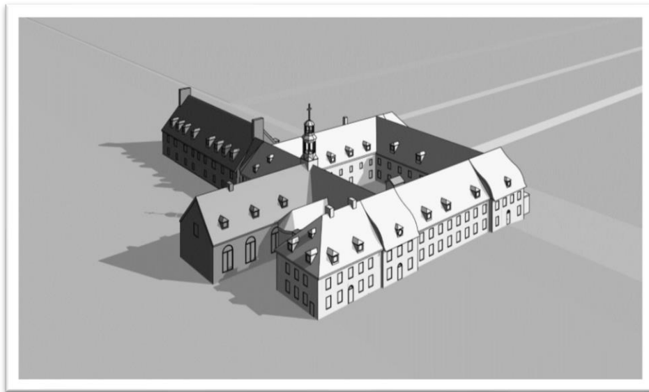
Monastère Notre-Dame-des-Ange et Hôpital général en 1775

La guerre arrivée en 1775 entre les Anglais et les Américains nous fit trembler à la vue d'une seconde crise, car les malheurs qui nous avait amenés celle de 1760, n'avaient pu être entièrement réparés et beaucoup moins oubliés. Notre crainte s'augmenta avec la nouvelle reçue que le Général Carleton était à Montréal lorsque fut annoncée l'arrivée des Américains; il partit aussitôt déguisé et s'embarqua dans un canot sauvage pour n'être point reconnu avant d'arriver à Québec, où sa présence était requise.