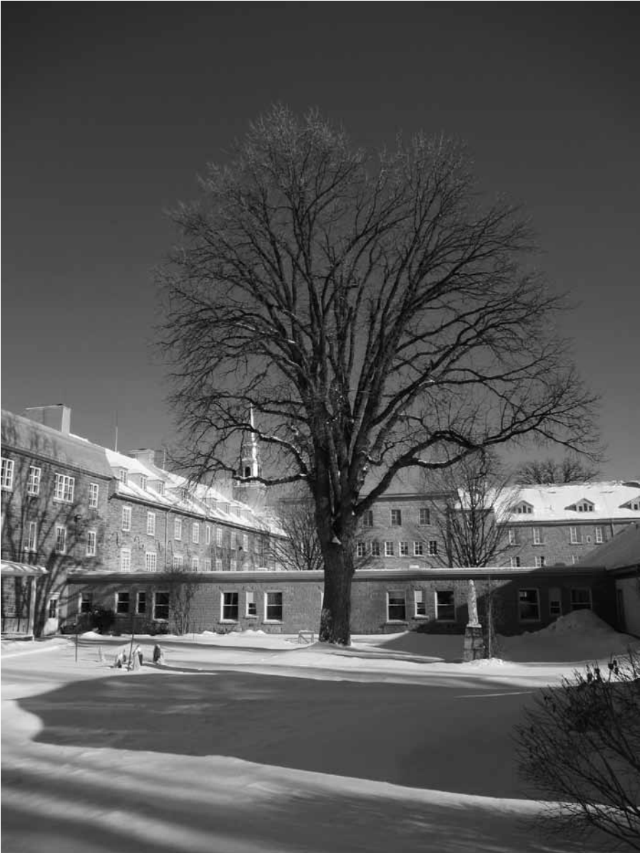
Un des chênes centenaires de l'Hôpital Général de Québec.