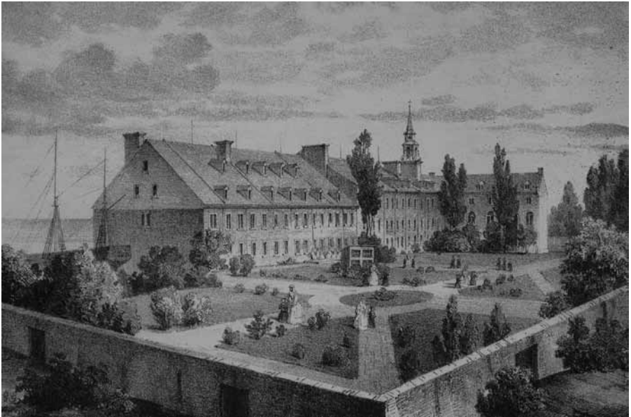
Vue ancienne du monastère des Augustines de l'Hôpital Général de Québec.